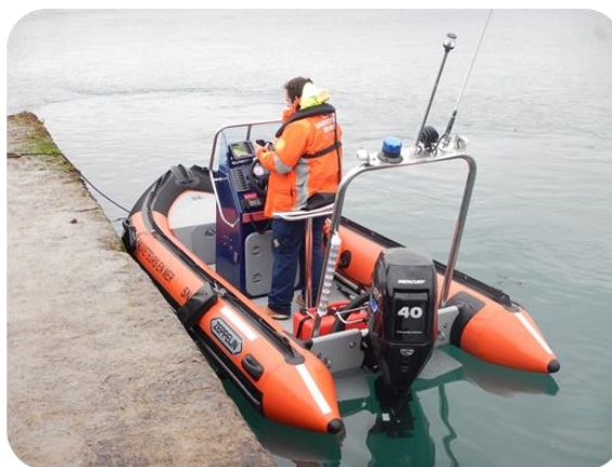
Configuration console assis debout