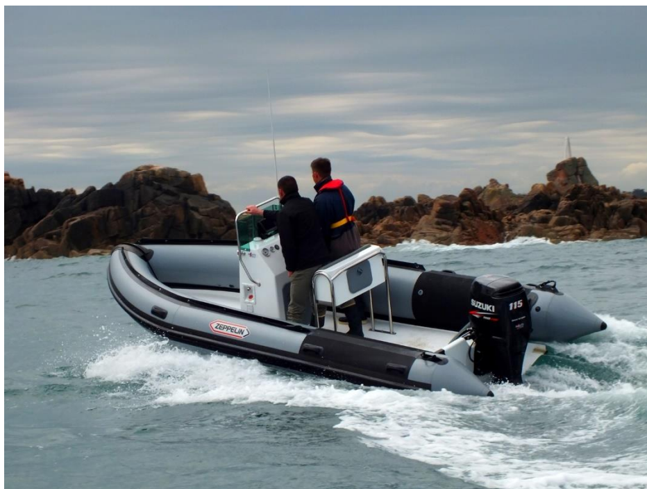
Exemple de réalisation