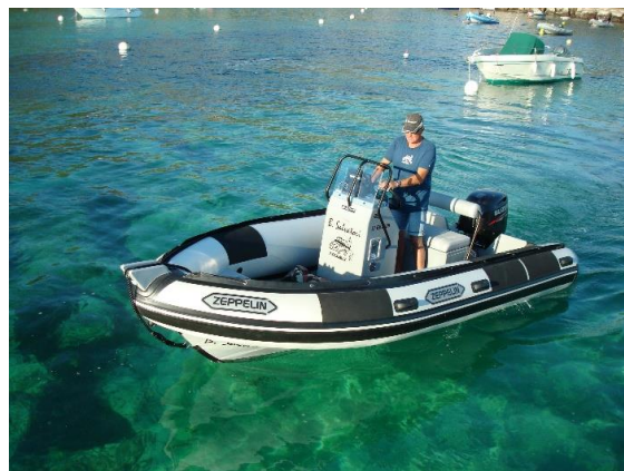
Exemple de réalisation