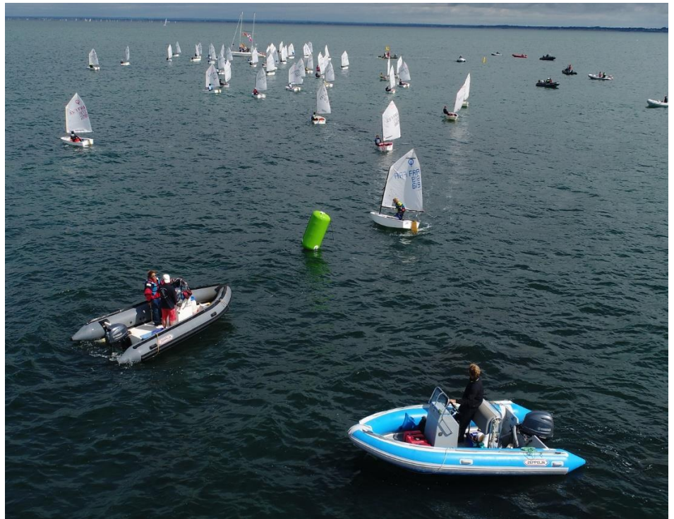
Exemple de réalisation