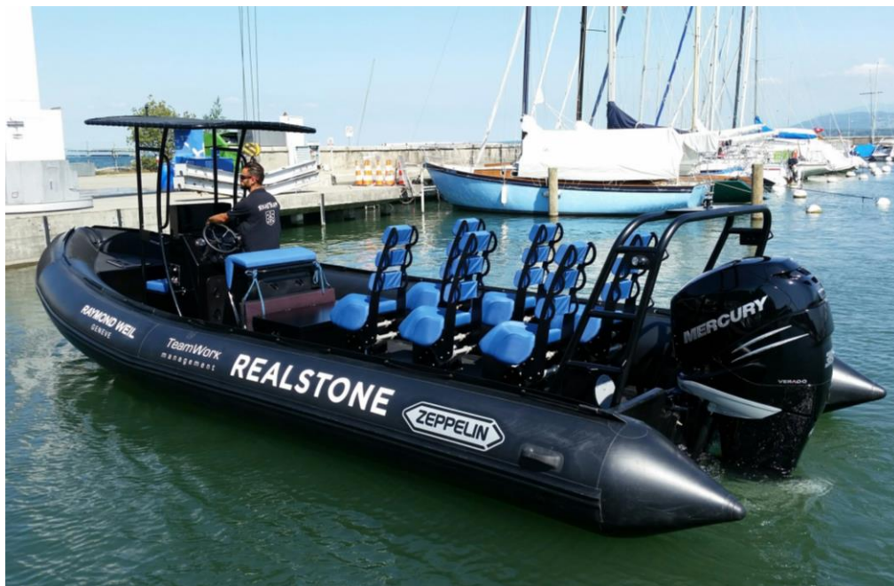
Exemple de réalisation