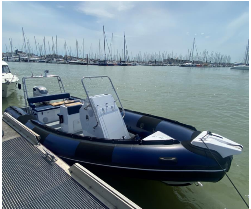
Exemple de réalisation