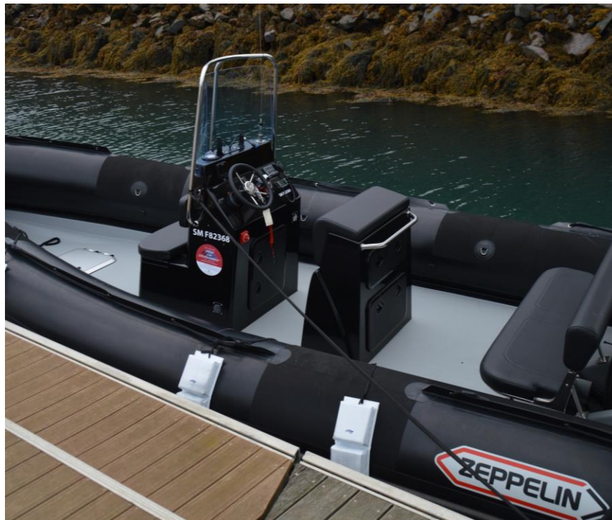
Exemple de réalisation