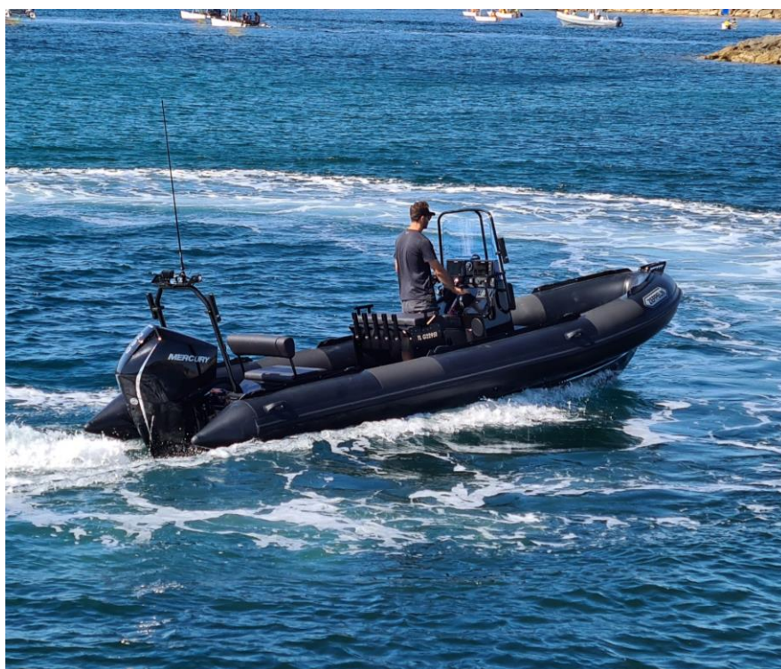
Exemple de réalisation : Commander 6.70