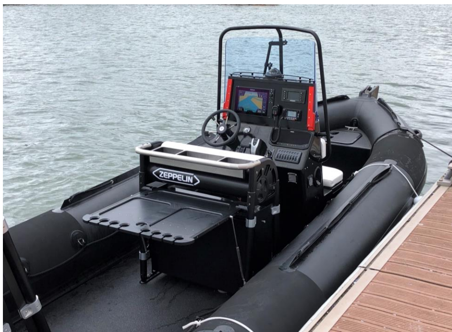
Exemple de réalisation : Command 21VPRO