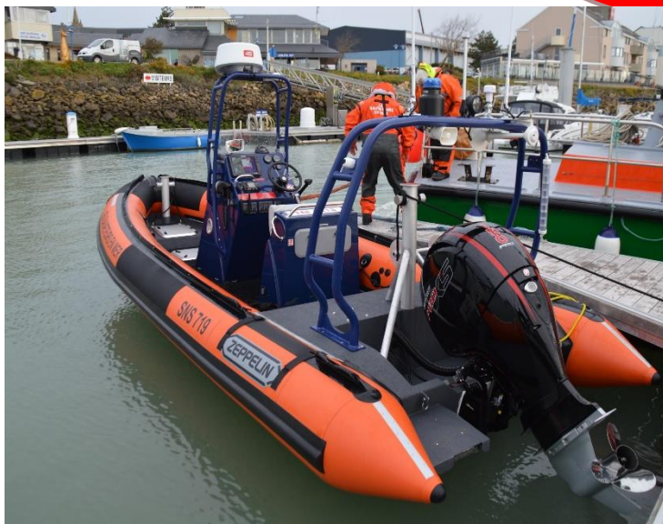
Exemple de réalisation XV ALU 698 - SNSM

Exemple de réalisation de bateau équipé. Réalisation sur-mesure possible et couleur carène, pont, flotteurs et équipements au choix.