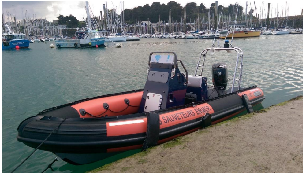
Exemple de réalisation – Société Nationale de Sauvetage en Mer