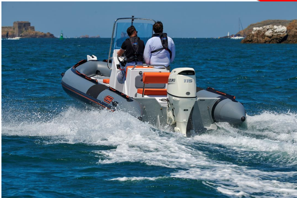
Exemple de réalisation – Command 20 VPRO série vitamine