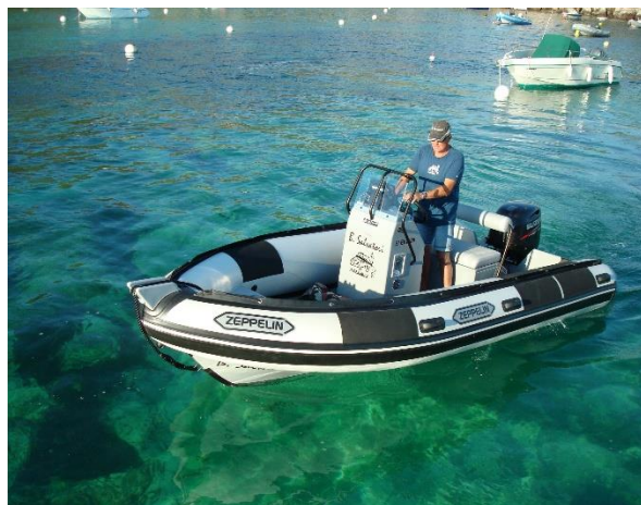
Exemple de réalisation