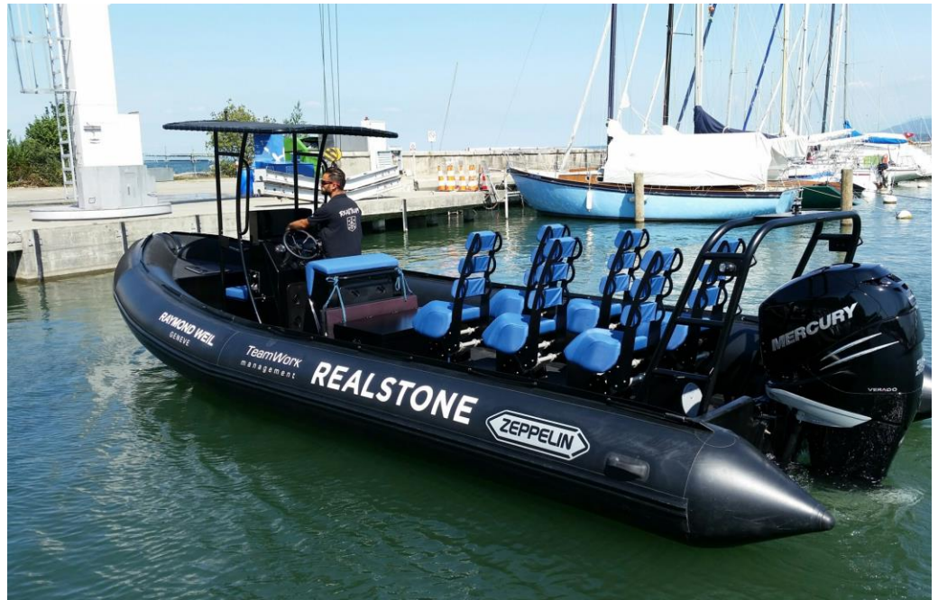
Exemple de réalisation