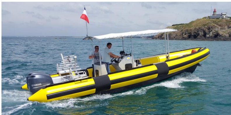
Exemple de réalisation