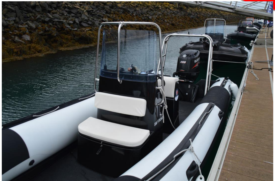
Exemple de réalisation