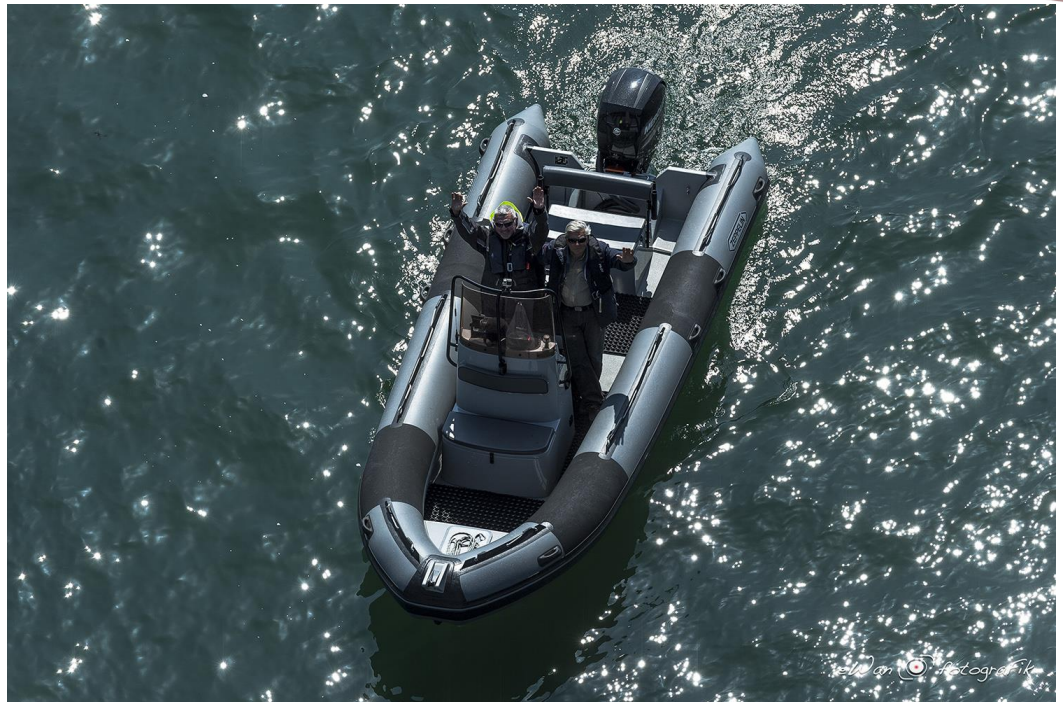
Exemple de réalisation