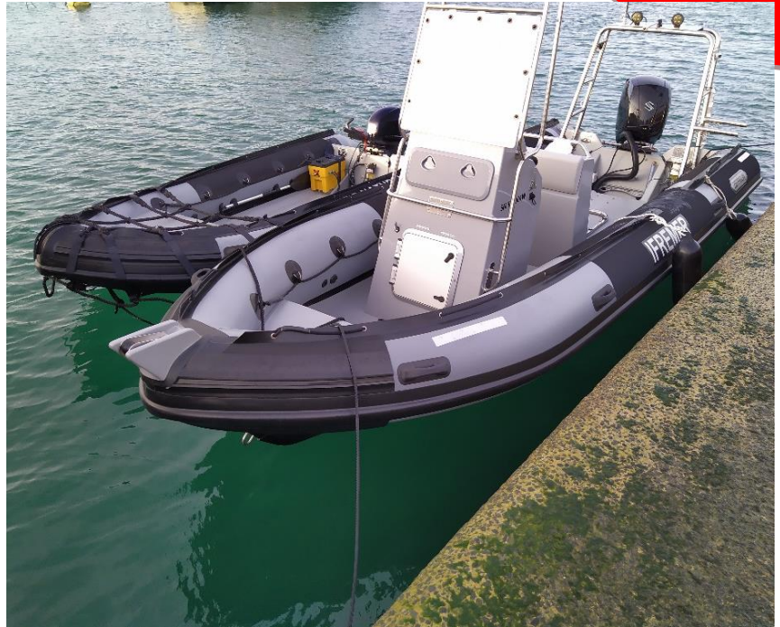
Exemple de réalisation – Ifremer