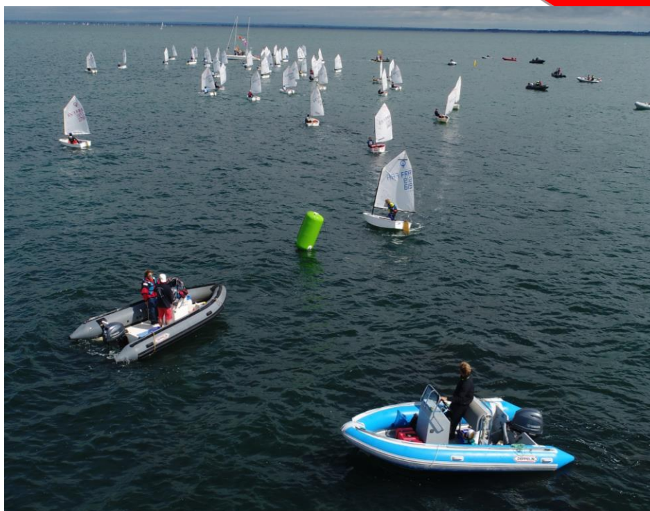
Exemple de réalisation