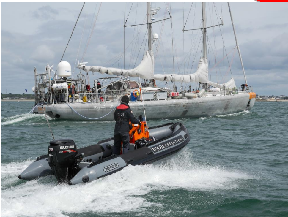
Exemple de réalisation – Tara Expéditions